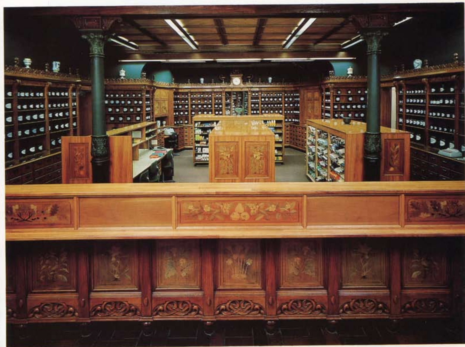
Bild 1. Apoteket Svanens officin. Inramande fack- och skåpsektioner i satinvalnöt, sammanhållna genom frisen upptill av stiliserade Arnica-blommor. Innehavarnas namn under frisen. I fonden klockparti samt i v och t h skåp för böcker resp. dubbelgifter. I förgrunden disken och förvaringsfack med intarsior. Kassetak och takbjälke på de två gjutjärnskolonnerna.