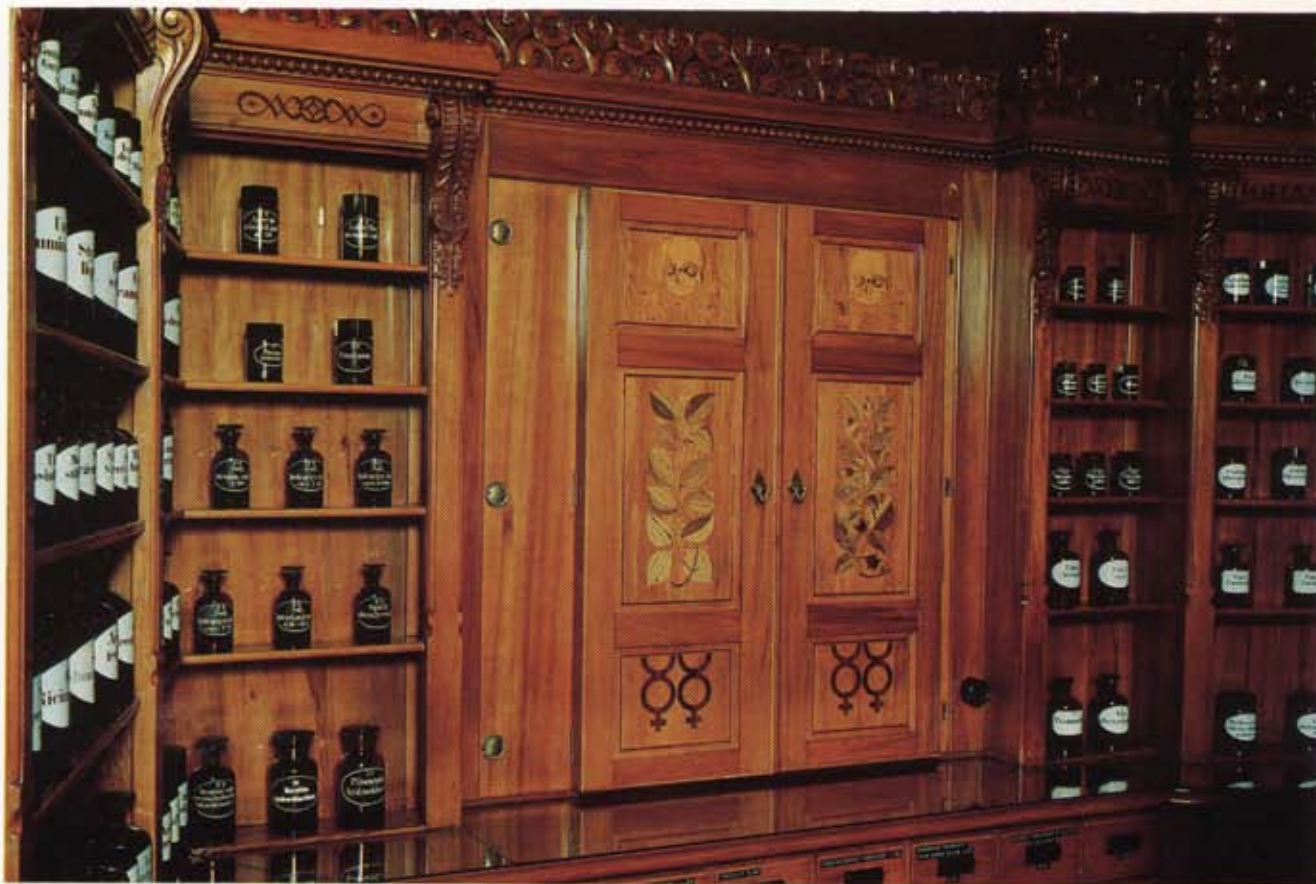
Bild 7. Skåp för dubbelgifter. Tre intarsia-par av olika giftsymbolmotiv på dörrarna. Överst dödskallar med korslagda benknotor. I mitten inläggningar av de giftiga växterna Strychnos nux vomica t v och Atropa belladonna t h. Längst ned dubbelgifttecken.