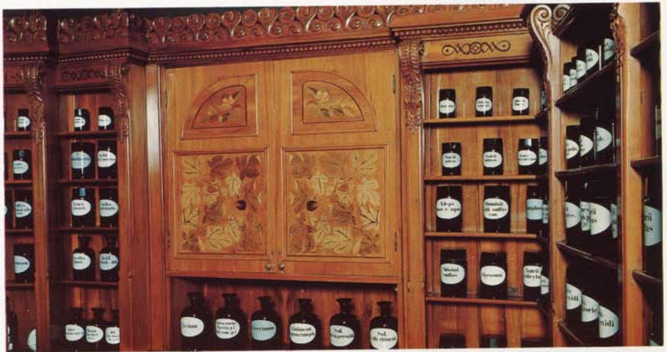
Bild 6. Skåp för böcker. Överst på dörrarna en av de vackraste intarsiorna, en cydoniagren med två blommor, och därunder intarsior med jikonmotiv.