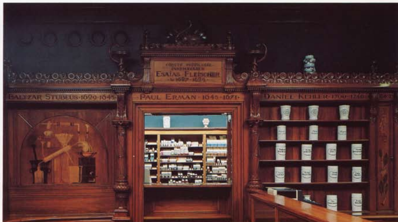
Bild 3. Portal vid receptmottagningen. I kartuschen inläggning i jakaranda: Förste privilegieinnehavaren Esaias Fleischer 5/6 1627—1629. I listen under namn på ett par efterföljare. På väggen t v om portalen en intarsia med apotekstekniskt motiv.