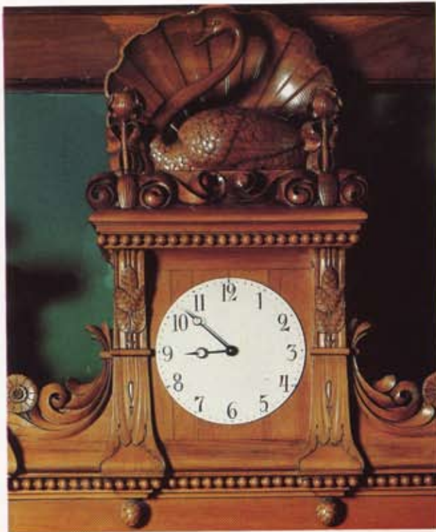
Bild 4. Klockpartiet. På båda sidor om klockan en stängel med rosenblad. Överstycke med svan och snäcka mellan två irisväxter.