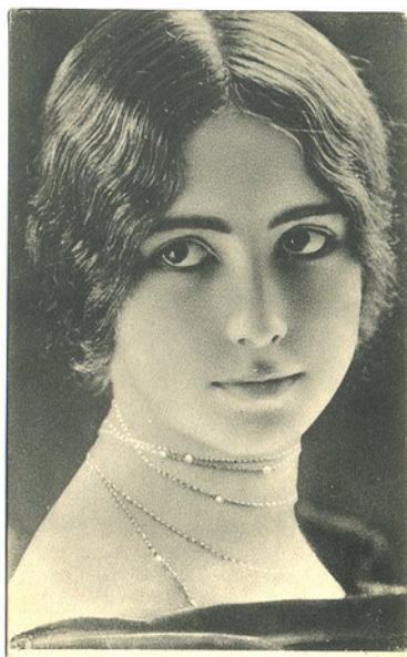
Cléo de Mérode.

Genom kamning och utseende ansågs hon mycket likna Cléo de Mérode, 7 den tidens pin-up-girl. En tänkare och frågare var hon av ärligaste slag.