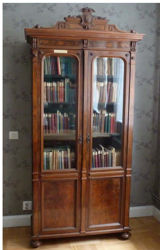
IOGT:s första studiecirkelbibliotek. Detta skåp innehåller böcker från IOGT:s första studiecirkelbibliotek. Det skänktes till Stadsbiblioteket av Samarbetskommittén för alkohol- och narkotikaupplysning i Lund.