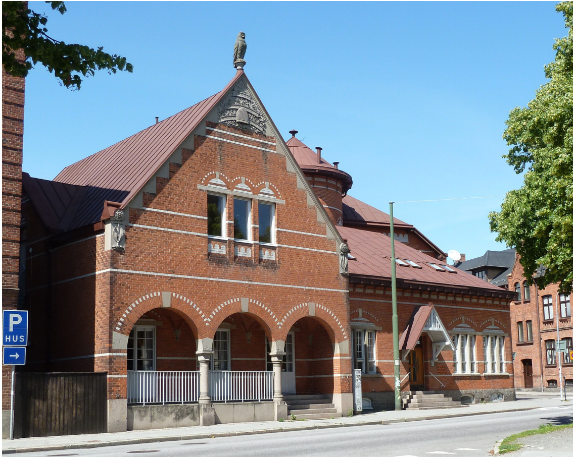
Församlingshemmet Ugglan. Huset står kvar och är fortfarande församlingshem.

År 1900 tröttnade kyrkostämman på att betala och biblioteket vände sig till stadsfullmäktige, som nu var moget för åsikten att "stadsbiblioteket icke torde vara att anse såsom någon till folkskoleundervisningen hörande anstalt". Folkskolan var nämligen fram till 1909 en kyrklig angelägenhet. Biblioteket beviljades ett årligt anslag om 500 kr, vilket ungefär motsvarar 25 000 kr idag.