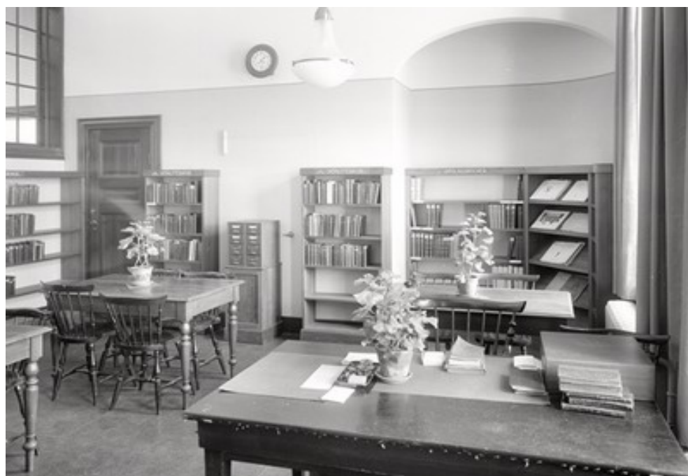
Barnavdelningen 1936. Man gick in till barnavdelningen från Stora Gråbrödersgatan över gården.

Man redovisade också användningen av läsesalen, eftersom den var en viktig service i dåtidens bibliotek. 1931 hade man nära 8 000 besök.