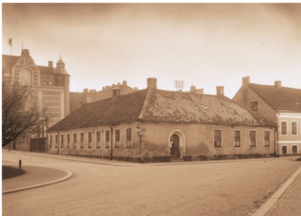
Gamla pastorsexpeditionen 1926. Huset revs för att 1928 ge plats åt en förvaltningsbyggnad för Domkyrko- och Allhelgonaförsamlingarna.

På 1920-talet fanns i Lund tre, för att inte säga fyra, parallella bibliotekssystem: stadsbiblioteket, Lunds arbetarbibliotek och studie-cirkelbiblioteken. Dessutom fanns Universitetsbiblioteket, men möjligheten att nyttja det var strikt förbehållet lärare och studenter vid universitetet. Lunds stadsbibliotek föddes noga räknat som ett sockenbibliotek. 32 I december 1864 beslöt kyrkostämman att tillsätta en Biblioteksdirection och i januari 1865 startades verksamheten, med lokal i pastorsexpeditionen. 33